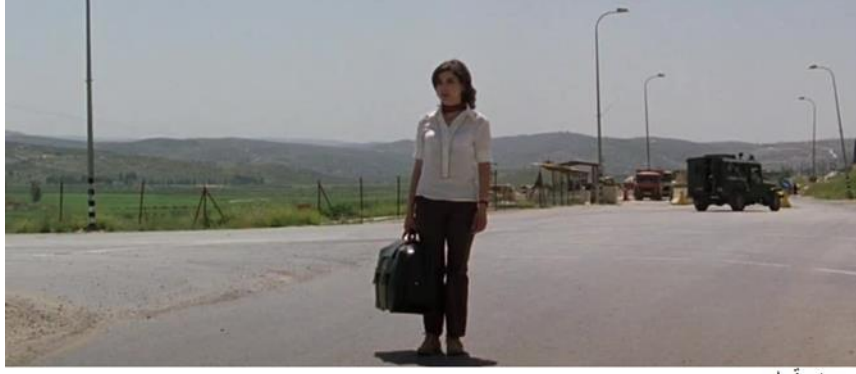
صورة رقم ٨

تتمتع سهى كعمقد في هذا الخطاب ، بخصائص خاصة تميزها عن سعيد وخالد: ١- تأمل دائما في المستقبل ومثال على ذلك المكان الذي يشتكي فيه سائق التاكسي من صعوبة الموقف: «نار الدنيا نار ، تقول سهى ردا على ذلك: «رح تفرج شي يوم»(دق: ٩). ٢- تتمتع بشخصية متعددة الثقافات ، لذا تختلف وجهة نظرها عن الآخرين؛ لأنها عاشت في أماكن مختلفة: «إني ولدت في فرنسا تربيت في المغرب وانت بتعرف انا عائدة»(دق: ٦). ٣- لها شخصية عاطفية. يبدو أنها وقعت في حب سعيد من النظرة الأولى ، وعلامته هو الضوء الأخضر الذي تظهره لسعيد؛ عندما قال سعيد لسهى ، أنا متأكد من أنك تحبين سيارة ألفاروميو ، وتقول سهى متدلة: «بس ابتعرف اسمها كتير حلو.الفاروميو»(دق: ٥)؛ هذا الخطاب يذكرنا بقصة حب روميو وجوليت لشكسبير؛ لذلك ، نظراً لأنها مغرمة ، فإنها تعطي الضوء الأخضر لسعيد للتواصل العاطفي. الاختلاف: من أهم مؤشرات قوة أي خطاب ، بالإضافة إلى سلسلة التكافؤ ، وجود الفروق والتمييز بين العلامات. إحدى حالاته هي نوع النظرة؛ حيث كانت تحديق فيها سهى في عيون الجندي الإسرائيلي في بداية الفيلم (صورة ٩)؛ يبدو أن لديها نظرة مستوية وتستمر في تكرار نفس الفعل (دق: ٢). لكن معناه لم يتضح بعد. حتى جمال ، أثناء تدريب سعيد وخالد ، يرى أنه علامة عدم الخوف من العدو من خلال التحديق في عينيه: «المهم ماتخافوش من الجنود الاسرائيلية والبلوسية وماتخافوش تتطلعو بعيونن دايم اطلعوا بعيونن اتزكروا انو السيطرة بايديكو والقوة بايديكو لانو حياتهم بايديكو»(دق: ٤١). تظهر هذه النظرة المستوية لسهى أن لديها شخصية شجاعة استمدت هويتها من قوتها الشخصية وتأثيرها.