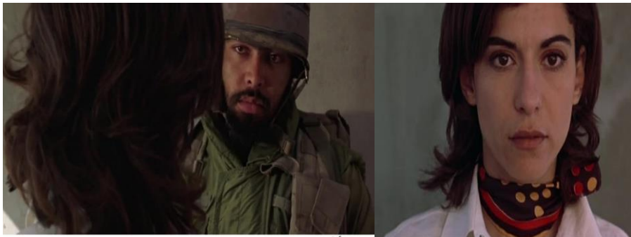
صورة رقم ٩

تتمتع سهى كعمقد في هذا الخطاب ، بخصائص خاصة تميزها عن سعيد وخالد: ١- تأمل دائما في المستقبل ومثال على ذلك المكان الذي يشتكي فيه سائق التاكسي من صعوبة الموقف: «نار الدنيا نار ، تقول سهى ردا على ذلك: «رح تفرج شي يوم»(دق: ٩). ٢- تتمتع بشخصية متعددة الثقافات ، لذا تختلف وجهة نظرها عن الآخرين؛ لأنها عاشت في أماكن مختلفة: «إني ولدت في فرنسا تربيت في المغرب وانت بتعرف انا عائدة»(دق: ٦). ٣- لها شخصية عاطفية. يبدو أنها وقعت في حب سعيد من النظرة الأولى ، وعلامته هو الضوء الأخضر الذي تظهره لسعيد؛ عندما قال سعيد لسهى ، أنا متأكد من أنك تحبين سيارة ألفاروميو ، وتقول سهى متدلة: «بس ابتعرف اسمها كتير حلو.الفاروميو»(دق: ٥)؛ هذا الخطاب يذكرنا بقصة حب روميو وجوليت لشكسبير؛ لذلك ، نظراً لأنها مغرمة ، فإنها تعطي الضوء الأخضر لسعيد للتواصل العاطفي. الاختلاف: من أهم مؤشرات قوة أي خطاب ، بالإضافة إلى سلسلة التكافؤ ، وجود الفروق والتمييز بين العلامات. إحدى حالاته هي نوع النظرة؛ حيث كانت تحديق فيها سهى في عيون الجندي الإسرائيلي في بداية الفيلم (صورة ٩)؛ يبدو أن لديها نظرة مستوية وتستمر في تكرار نفس الفعل (دق: ٢). لكن معناه لم يتضح بعد. حتى جمال ، أثناء تدريب سعيد وخالد ، يرى أنه علامة عدم الخوف من العدو من خلال التحديق في عينيه: «المهم ماتخافوش من الجنود الاسرائيلية والبلوسية وماتخافوش تتطلعو بعيونن دايم اطلعوا بعيونن اتزكروا انو السيطرة بايديكو والقوة بايديكو لانو حياتهم بايديكو»(دق: ٤١). تظهر هذه النظرة المستوية لسهى أن لديها شخصية شجاعة استمدت هويتها من قوتها الشخصية وتأثيرها.