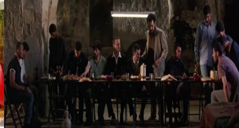
صورة رقم ٧