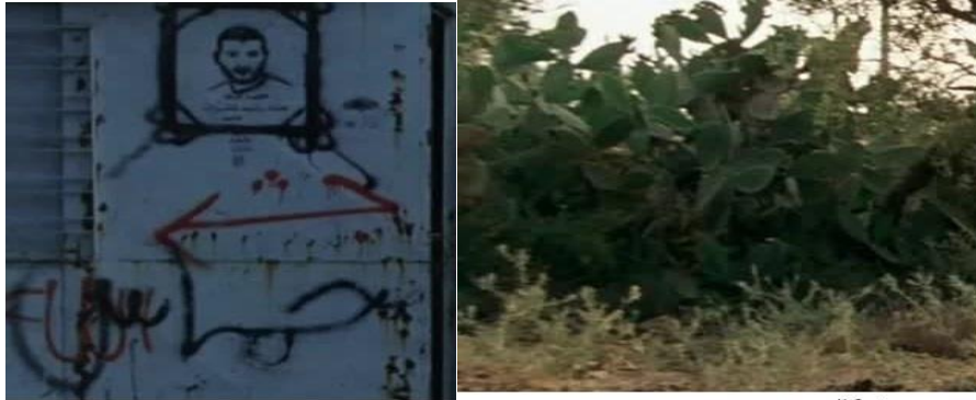
صورة رقم ٣