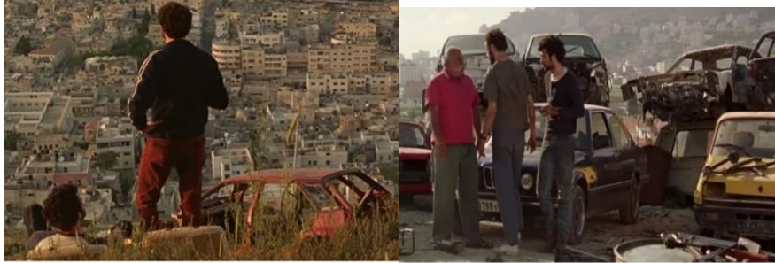
صورة رقم ٥