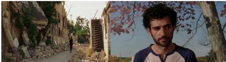
صورة رقم ١١