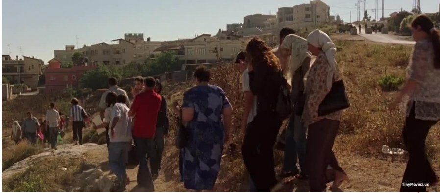
صورة رقم ١

الشاغل للفلسطينيين. "باعتبارها صراع وجود ضد وجود، أي إنه يتضمن في جوهره التناقض الحتمي بين الوجود الصهيوني من جهة، والوجود العربي والفلسطيني من جهة أخرى، والتأكيد على أن فلسطين كانت عبر التاريخ، عربية دائماً، وأن الشعب العربي الفلسطيني، لم يكن مغفلاً في حديث التاريخ، بل له حضوراً فاعلاً على كافة المستويات.. " (ابراهيم، ٢٠٠٥م: ٦). فإن نشوء خطاب المقاومة يعود إلى اغتصاب الأرض الفلسطينية وقتلهم وتشريدهم، ونتيجة لذلك فإن هويتهم تعرضت للتعفن. في هذا الفيلم، أغلق العدو المحتل كل الطرقات بإقامة نقاط تفتيش وحواجز، ولا خيار أمام الناس سوى الضلال (صورة ١). فربما سبب العمليات الاستشهادية هو إغلاق كل طريق أمام الناس الذين ليس لديهم خيار سوى القيام بذلك.